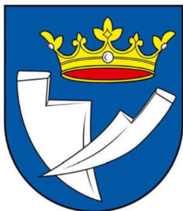
Erb obce Popudinské Močidlany

Znamenie je vložené do dolu zaobleného, tzv. neskorogotického, či tiež španielskeho heraldického štítu. I keď sa v heraldickej tvorbe v minulosti používali rôzne tvary štítov, tento je v našej erbovej tvorbe najobvyklejší, používa sa vo všetkých heraldických katalógoch s erbmi miest a obcí.