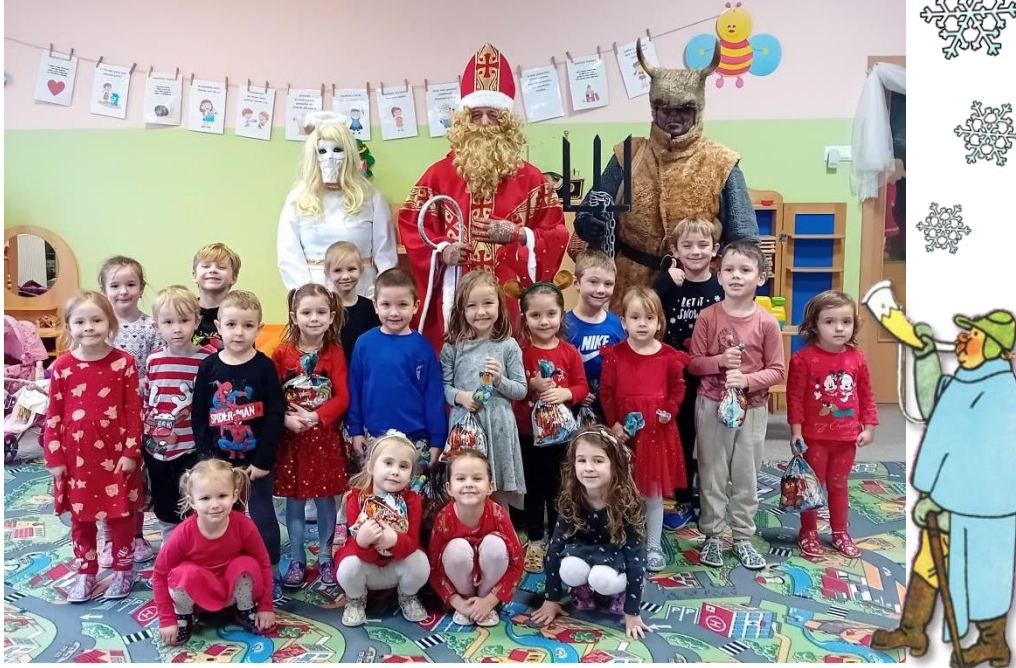
6.12.2024 navštívil deti z MŠ aj ZŠ sv. Mikuláš s jeho pomocníkmi. Viac ďalej v Hlásniku.