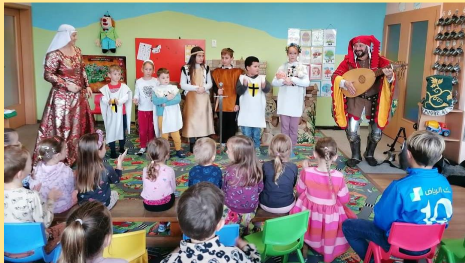
Deti v materskej škole pri predstavení rytiera Gastona

V stredu 6. decembra 2024 čakali na sv. Mikuláša aj deti v našej škôlke (fotografia hore). Pre mnohé z nich to bolo po prvýkrát, čo ich Mikuláš navštívil mimo ich domov a napodiv ani jeden malý škôlkár nezaplakal. Čerta sa deti taktiež nebáli, veď podľa slov pani riaditeľky a pani učiteľky všetky deti v škôlke sú poslušné...tak prečo by sa mali báť? Najväčšiu radosť však mali, ako ich starší kamaráti v škole, zo sladkých balíčkov, ktoré im sv. Mikuláš priniesol.