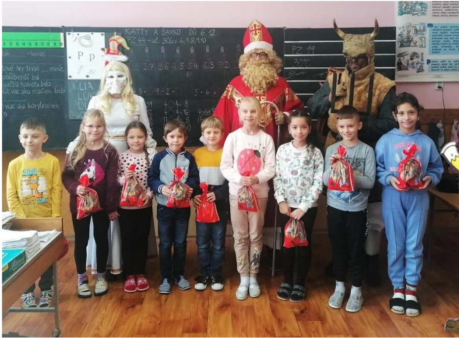
Streda 6. decembra 2023 patrila aj v našej obci najmä sv. Mikulášovi a jeho dvom nadpozemským pomocníkom. Viac ďalej v Hlásniku. Fotografia hore: 1. a 3. ročník našej ZŠ.