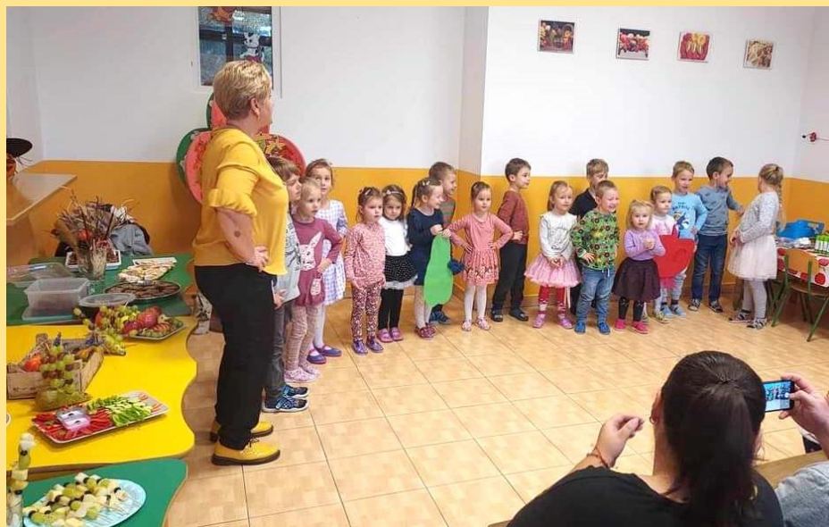
Deti v materskej škole pri tradičnej besiedke „Dary Zeme“ spolu s rodičmi