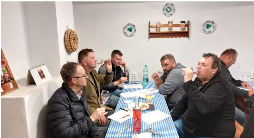
Záhradkársky a vinohradnícky spolok Popudinské Močidlany