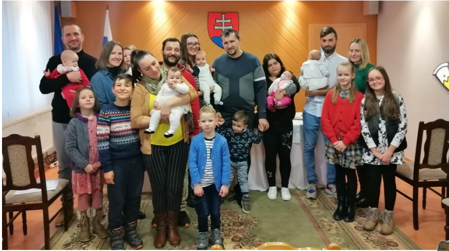
V stredu 25.01.2023 sme do života obce uvítali všetky deti narodené v roku 2022.